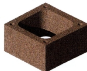
L x B x H in cm: 43,0 x 43,0 x 24,0