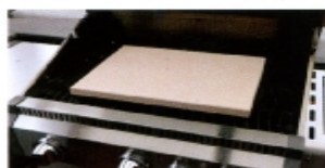
Pizzabackplatte für Elektro-Backofen & Gartengrill