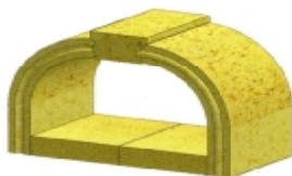
Nut & Feder Gewölbehälbplatten und Anpaßmittelsteine