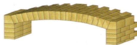
Halbwölber & Widerlager für Flachgewölbe