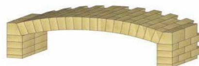
Halbwölber & Widertager für Flachgewölbe

Weitere Schamotte-Formate, Mörtel, Vergussmassen und Formteile erhalten Sie auf Anfrage!